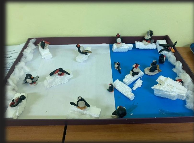
Макет «Пингвины на льдине»