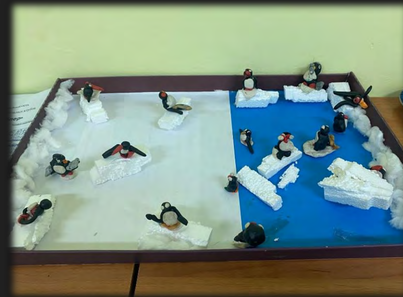
Макет «Пингвины на льдине»